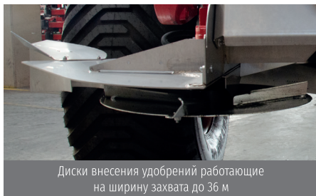
Диски внесения удобрений работающие на ширину захвата до 36 м