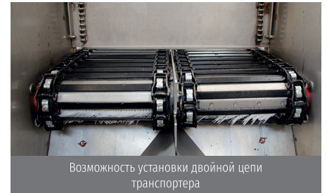
Возможность установки двойной цепи транспортера