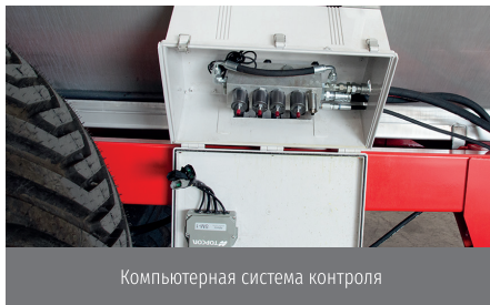
Компьютерная система контроля