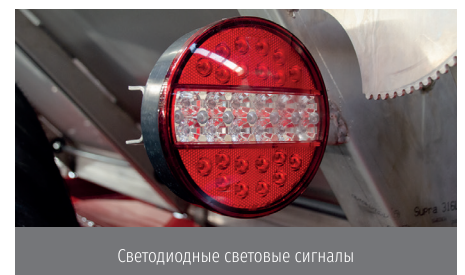
Светодиодные световые сигналы