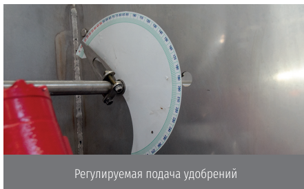
Регулируемая подача удобрений