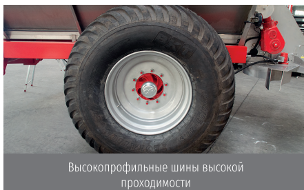
Высокопрофильные шины высокой проходимости