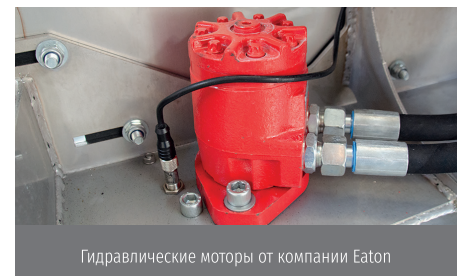
Гидравлические моторы от компании Eaton