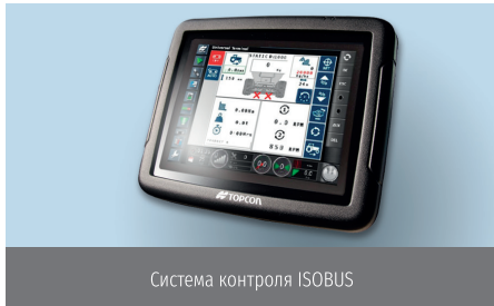
Система контроля ISOBUS